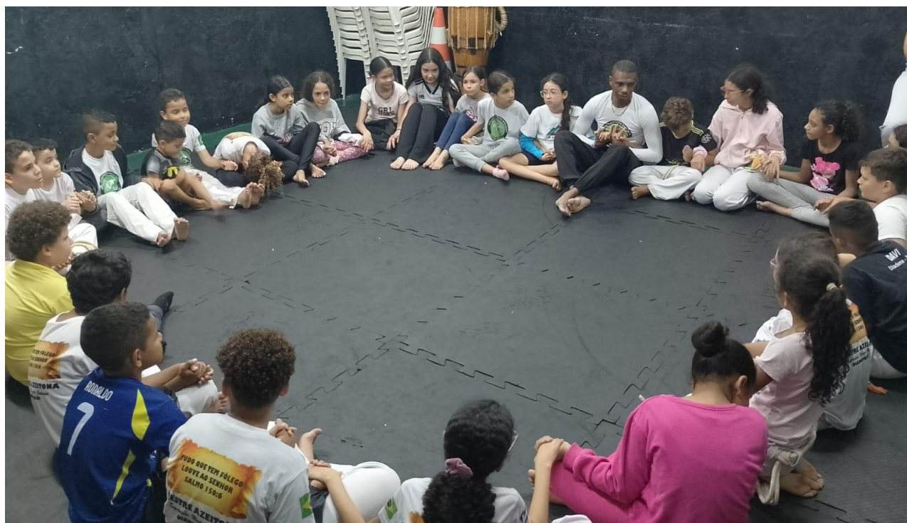
Ações grupo Shekinah