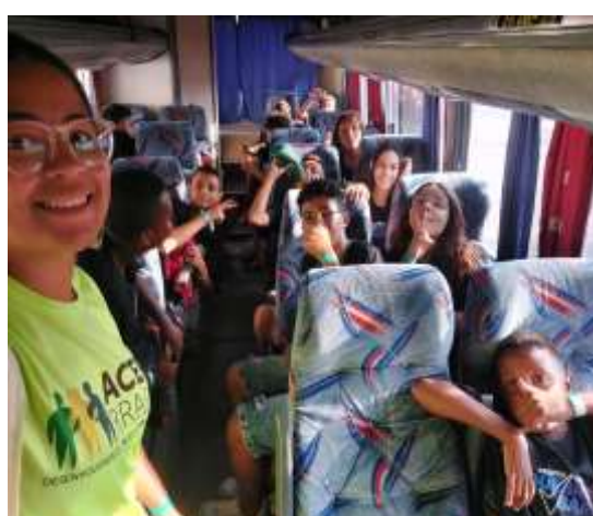
Participação das crianças