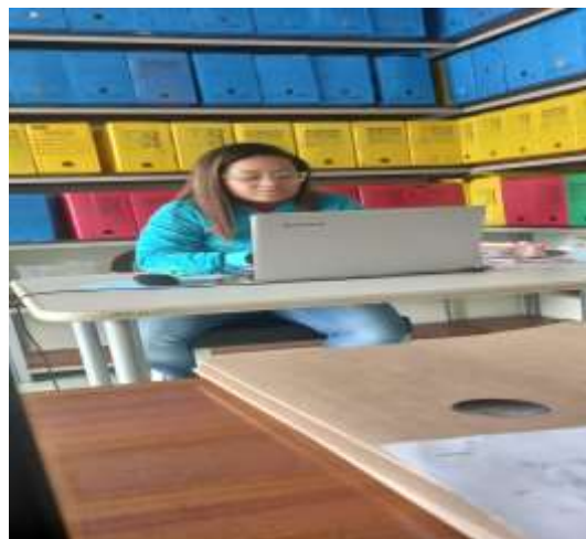
Estagiária do monitoramento

Ao longo do mês sucederam-se quatro encontros de supervisão com monitoramento, abordamos questões de presença e ausência, visitas domiciliares para famílias específicas.