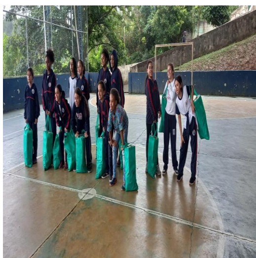
Atendidas Florestan Fernandes