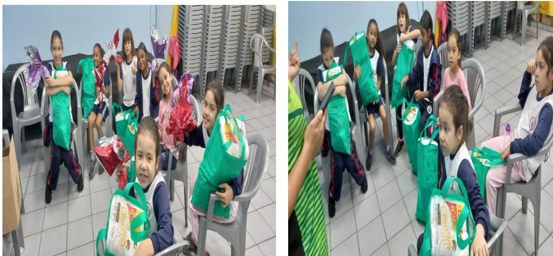
Entrega dos kits e ovo de páscoa

Realizamos atividade na escola Fabíola com as meninas no período da noite, a proposta do trabalho foi dialogar com as meninas sobre saúde o ponto inicial foi a higiene pessoal, adentramos em alguns ponto de discussão envolvendo a família, o que as meninas relatam a relação com os pais, discorre informando sobre os vínculos fragilizados na interação com os genitores.