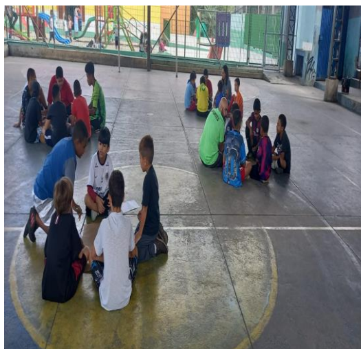
Sub 10 - Masculino