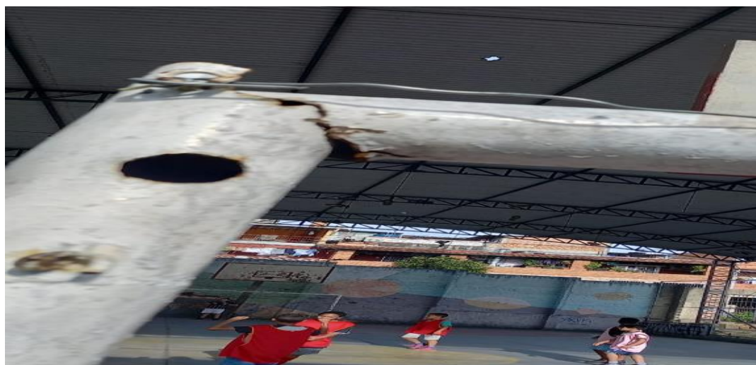
Travessão da quadra

Observamos que o local de treino, precisa passar por uma manutenção, devido risco iminente de acidente grave, acontecer durante horário de treino.