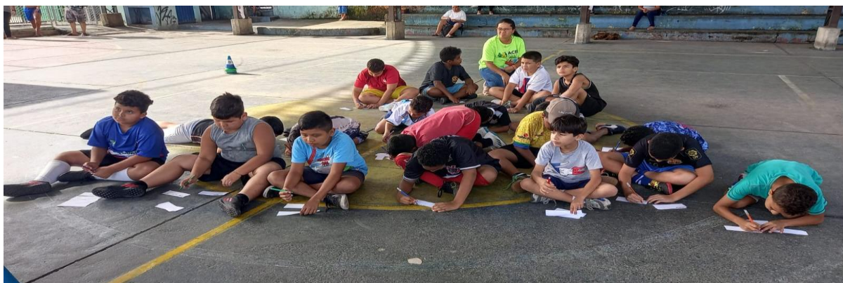
Sub 10 - tarde masculino

A dinâmica desenvolvida no esporte foi trabalhar as emoções das crianças, pois, observamos o comportamento agressivo, bullying, para tanto criamos uma dinâmica para refletir sobre esses comportamentos melhorando a convivência, comunicação e socialização, realizamos roda de reflexão com objetivo sobre as ações praticada pelo grupo, os impactos que reverberam no coletivo.