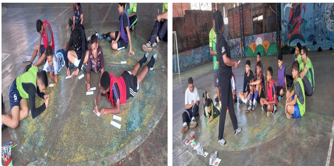
Sub 14 masculino

Devido às observações dos professores em identificar os alunos com nível de agressividade na fala, comportamento e principalmente durante aula, pensamos em falar sobre nossos sentimentos e refletir sobre o que nos leva a tomar essas ações, sendo assim podemos refletir de como evitar uma situação danos maiores na convivência durante atividade.