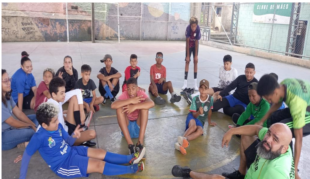
Sub 14 - Masculino Futsal

Observamos que o local de treino, precisa passar por uma manutenção, devido risco iminente de acidente grave, acontecer durante horário de treino.