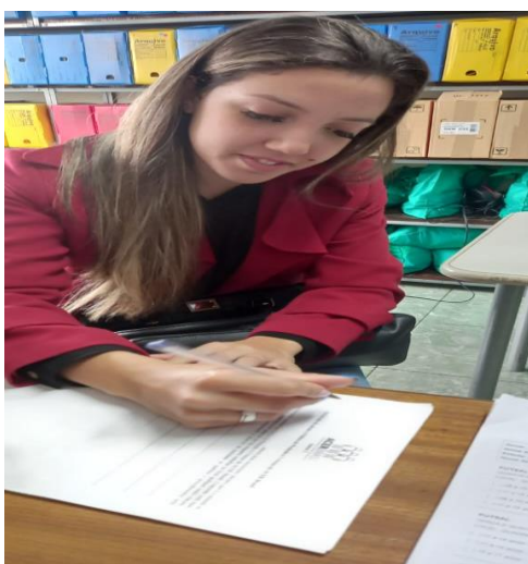
Estagiária do Administrativo

No final do mês realizei formação de adesão à política de proteção com a estagiária do administrativo que passará a fazer parte da equipe ACER.