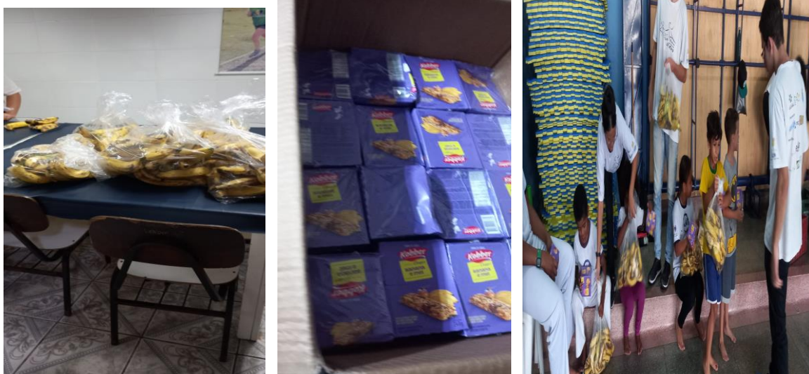
Ação de montar kits entregar para as crianças