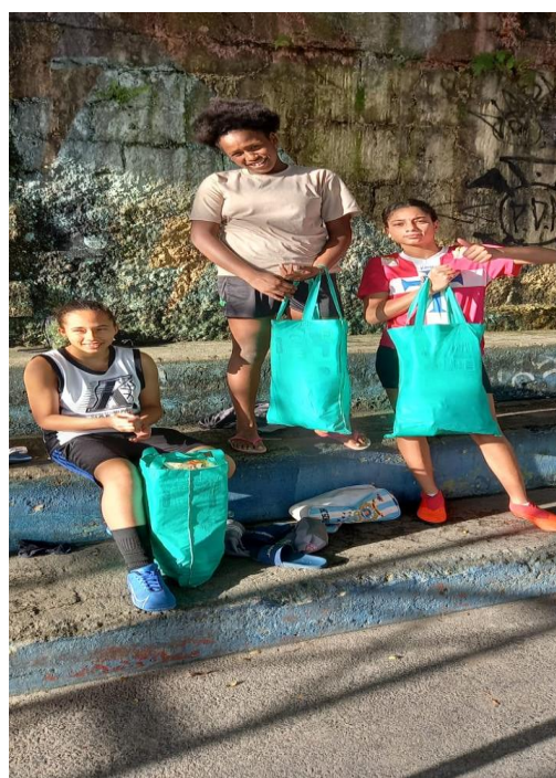
Atividade com as meninas

Posterior à atividade com grupo completo, foi realizada uma atividade à parte com as meninas sobre as questões de higiene pessoal.