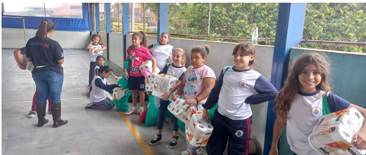
Atividade escola Pirô

Realizamos atividade na escola Pirô para 14 meninas, atividade foi falar sobre a puberdade, e o processo de cuidados higiênico, a característica maior das meninas fora que falaram sobre a responsabilidade de cuidados e organização da casa.