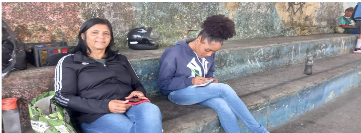
Participação dos responsáveis

Enquanto os meninos realizavam atividade no centro da quadra, os responsáveis também realizaram uma atividade para refletirem como poderiam contribuir, enquanto aguardavam os meninos.