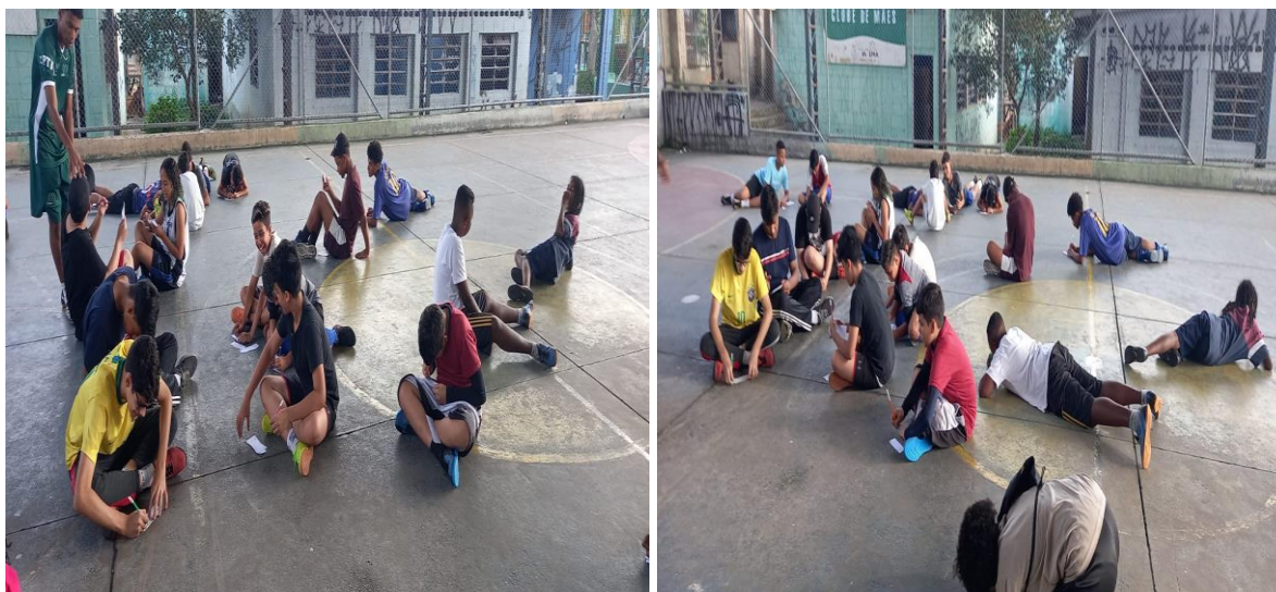
sub 14- futsal misto

Posterior à atividade com grupo completo, foi realizada uma atividade à parte com as meninas sobre as questões de higiene pessoal.