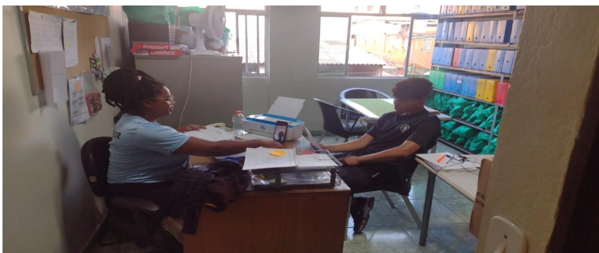
Membros da equipe Acer