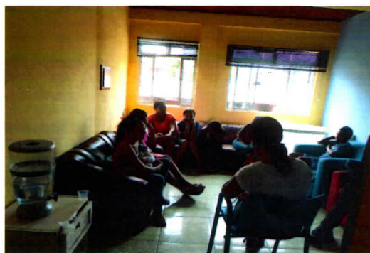
Reunião com equipe de educadores e ex-atendidos pelo projeto Menino Cidadão