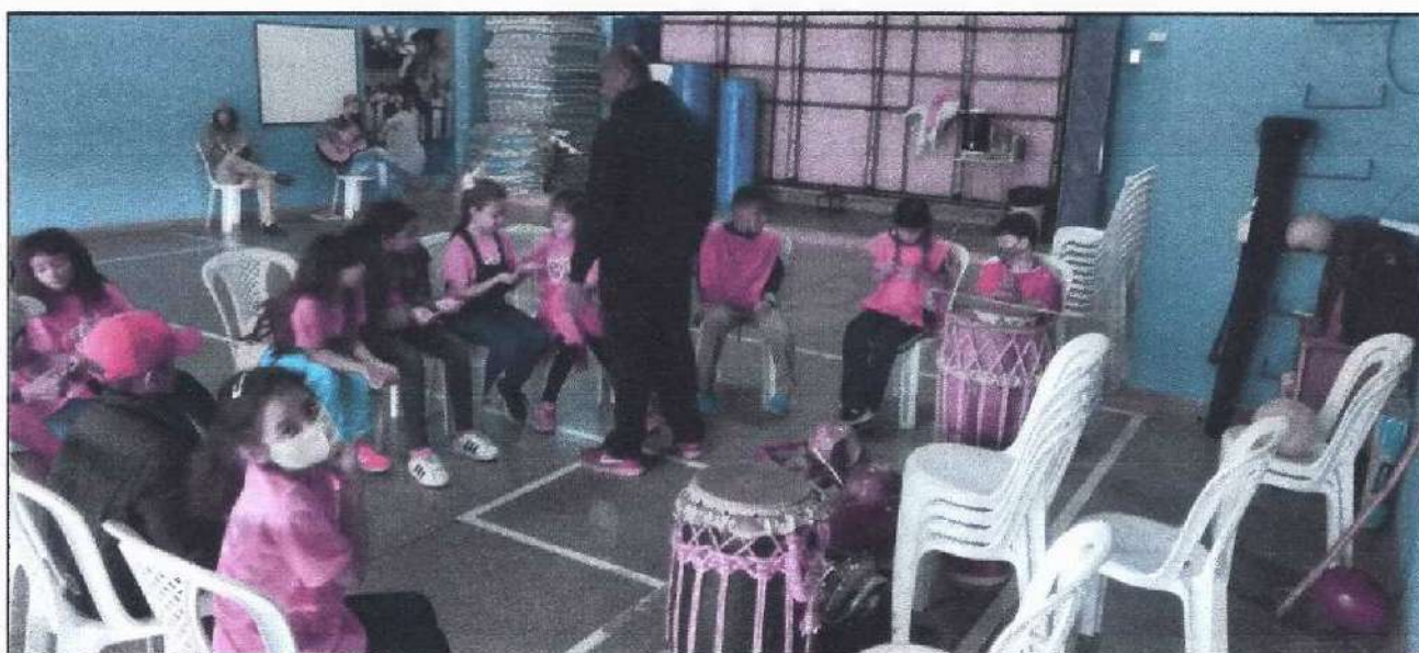
Atividade com a turma Tatu Bola

Na terceira semana foi repetido o circuito da primeira semana, pois como algumas turmas faltaram, desta forma o planejamento voltou a ser aplicado, ao aplicar o circuito as crianças tiveram muita dificuldade no rolamento, na estrelinha, na cambalhota e na ponte, e todos esses movimentos acabam tendo uma ótima aceitação das crianças, tanto que elas pediram para continuar fazendo.