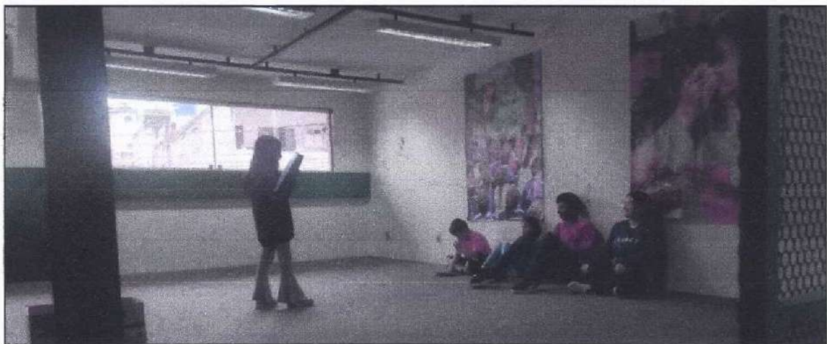
Criança da turma Mico-Leão fazendo a leitura

Após o término da leitura compartilhada, as crianças puderam fazer sua própria leitura, ao terem acesso ao acervo de livros da ACER. Com algumas crianças é feita uma leitura acompanhada, onde os mediadores auxiliam as mesmas com a leitura. Em dias com poucas crianças, algumas delas se oferecem para também fazer uma leitura compartilhada.