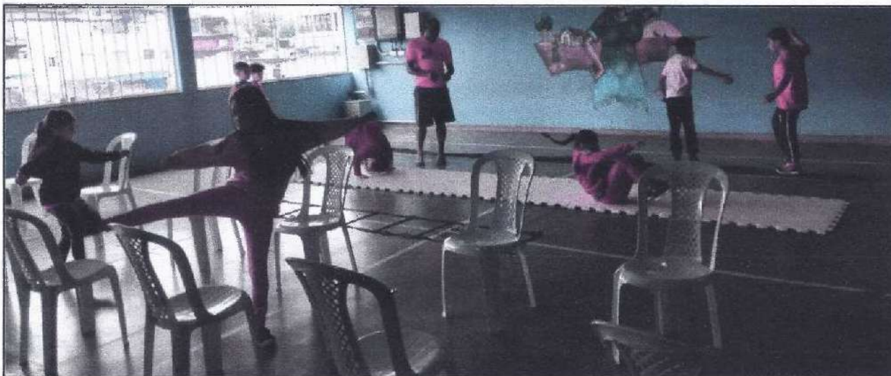
Atividade com a turma Arara Azul

Na terceira semana foi repetido o circuito da primeira semana, pois como algumas turmas faltaram, desta forma o planejamento voltou a ser aplicado, ao aplicar o circuito as crianças tiveram muita dificuldade no rolamento, na estrelinha, na cambalhota e na ponte, e todos esses movimentos acabam tendo uma ótima aceitação das crianças, tanto que elas pediram para continuar fazendo.