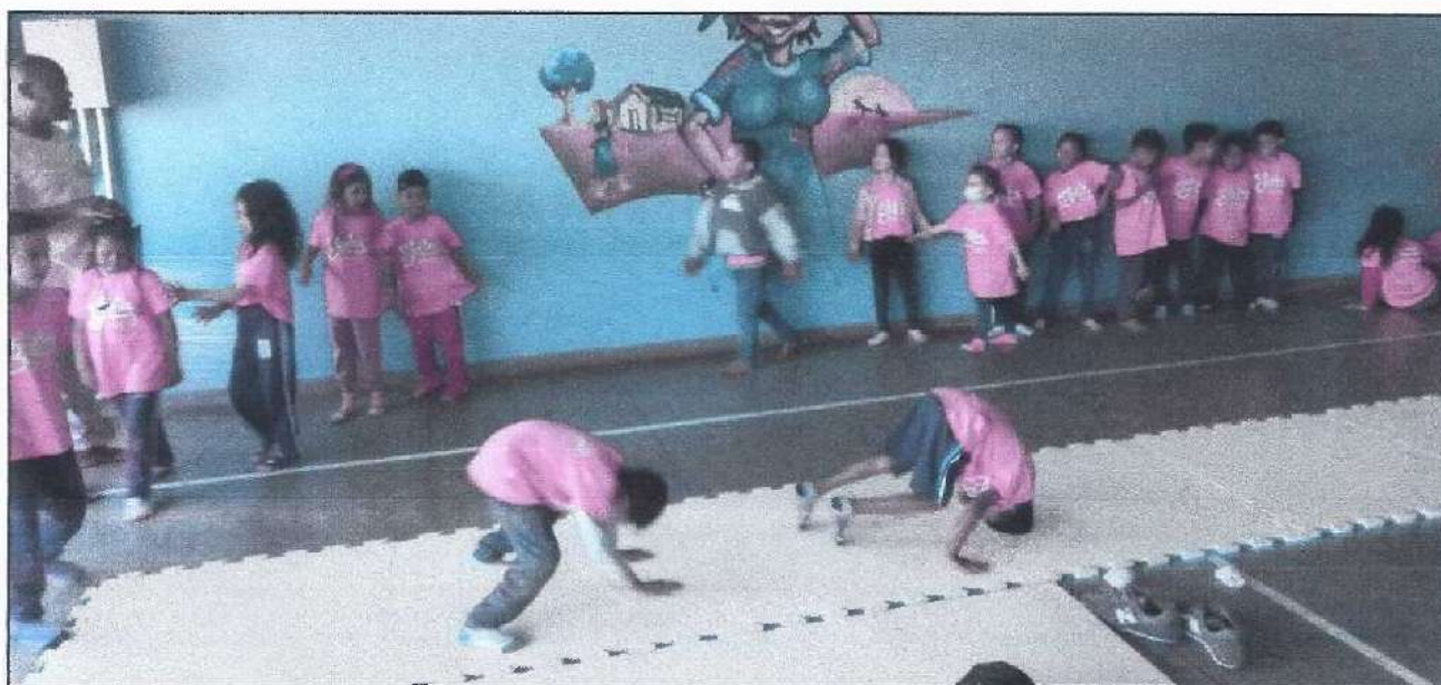
Atividade com a turma Formiga

Na primeira semana, foram aplicados movimentos de capoeira em forma de circuito, onde cada movimento foi realizado em formato de estação, e esses movimentos eram executados com auxílio as crianças que apresentavam dificuldade, já os que conseguiam fazer sozinhos tiveram livre acesso. Os movimentos aplicados foram, rolamento, ponte, estrelinha e armada giratória, as turmas que conseguiram executar todos os movimentos foram aplicadas duas brincadeiras, “pega-pega senta” e “mãe da rua com queimada”.