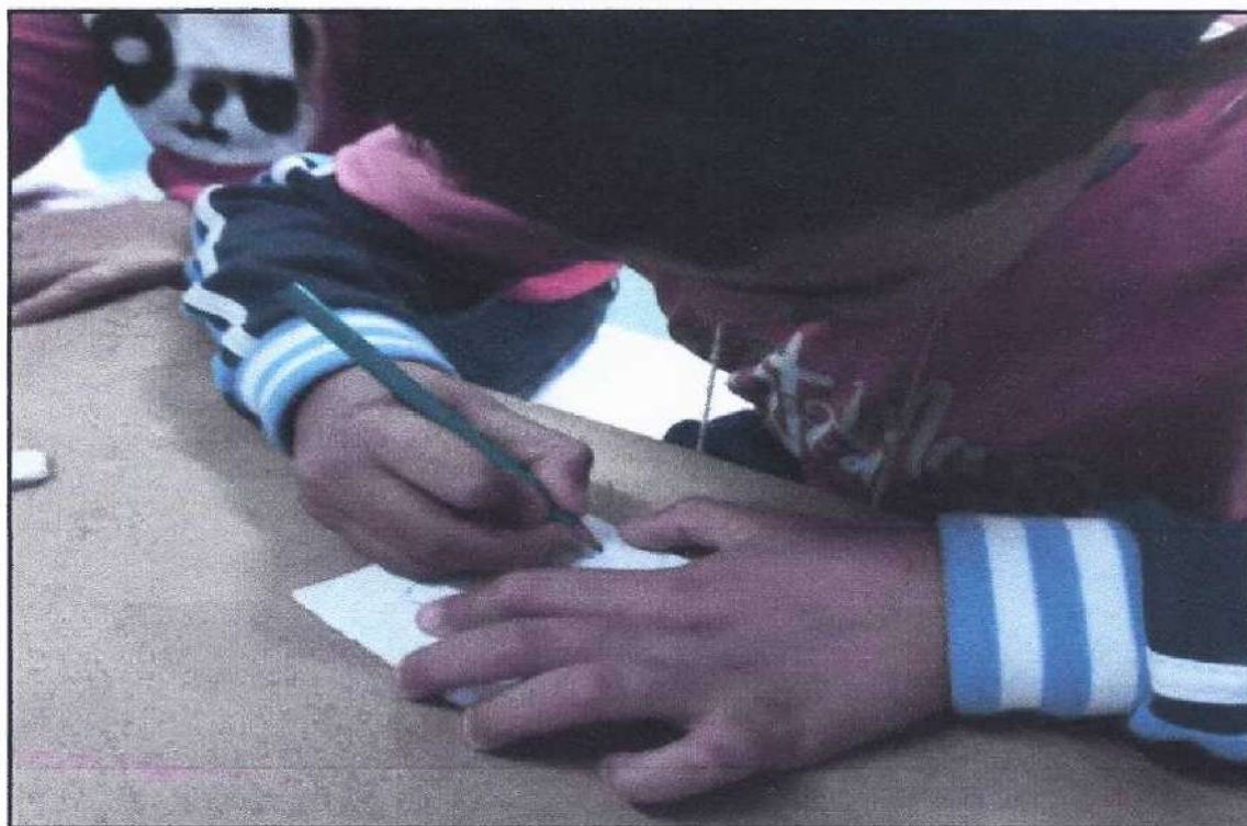
Criança da turma Tucano2 fazendo a atividade artística

fica maravilhada com o lugar e resolve fazer sua casa, antes de começar ela cerca o local e passa a acreditar que Tupã estava ajudando-a, por encontrar um lugar perfeito para fazer sua morada. No dia seguinte, o coelho chega até o terreno e vê que o mesmo estava cercado e acredita que aquilo era uma ajuda de Tupã, cheio de gratidão pela ajuda constrói as paredes e o telhado. Ao ir embora, novamente a anta volta e terminou de construir a casa, colocando portas e janelas. Com a casa pronta, os dois decidem se mudar, durante a mudança descobrem que o terreno eram dos dois, assim começam a discutir para saber de quem ficará na casa, pois ambos estavam acreditando que Tupã estava ajudando. Com isso, a anta faz uma sugestão, construir uma casa idêntica e o outro se mudaria quando finalizada. O coelho não aceitou a proposta de primeira e discordou totalmente da ideia, alegando que a casa poderia ser pequena demais ou grande demais, mas após umas boas risadas depois da explicação da anta para acalmar o coelho, tudo se resolveu. No fim, possivelmente era tudo parte do plano de Tupã, unir e fazer com que fossem solidários uns com os outros. A atividade artística foi feita uma dobradura de um coelho onde o mesmo conseguia pular.