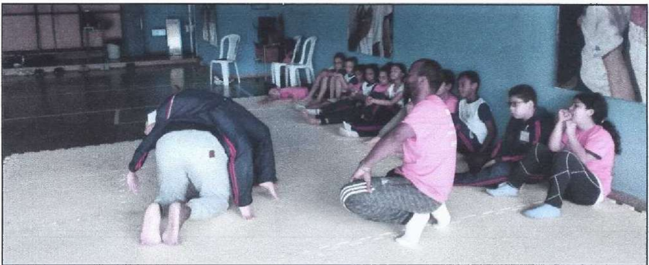
Atividade com a turma Onça2

Na quarta semana foi feito com as turmas, movimentos que trabalharam a parte abdominal, a flexibilidade, a lombar e a força. A maioria conseguiu executar todos os movimentos propostos de maneira correta, a aula teve um foco também nas relações entre elas, pois ao longo das aulas demonstraram um pequeno de desgaste e por este motivo foram colocadas em duplas ou trios, assim puderam perceber a importância da amizade, vale ressaltar que a capoeira é um esporte coletivo que possui suas individualidades, mas prioriza o coletivo.