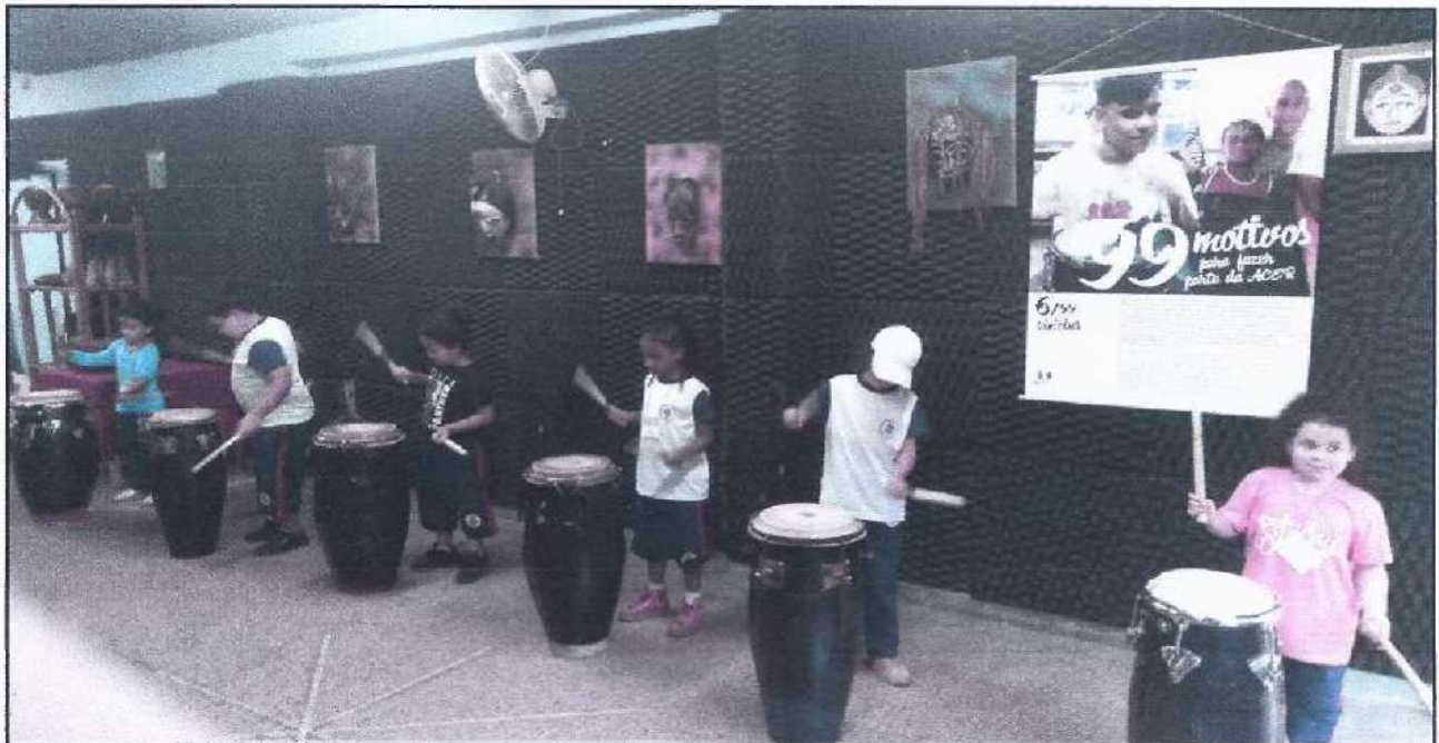
Turma Tatu- Bola

Na quinta semana, as crianças já estavam tocando sozinhas o ritmo Wantaburico. A alegria que elas transmitem ao conseguir fazer o toque é gratificante.