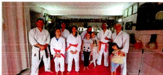
Equipes que disputaram o 27º campeonato de Karatê Inter Estilos