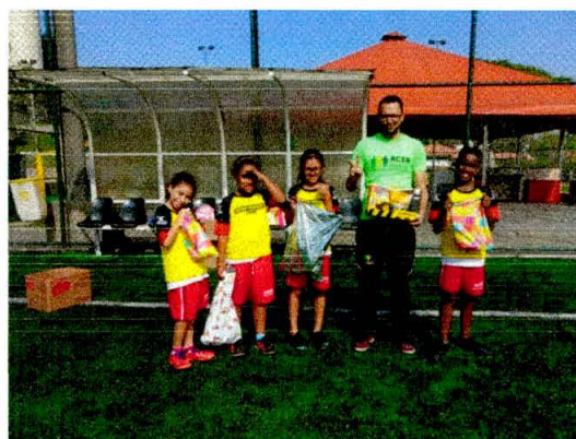
Entrega dos Brinquedos e chuteiras para os atendidos do Futsal e Rugby