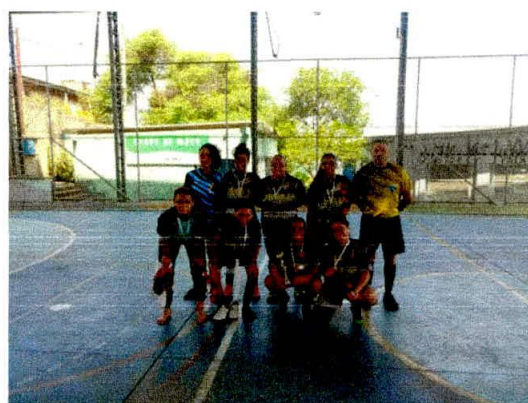
Festival de Futsal Feminino ACER BRASIL com as presenças das equipes Estrelas F.F. Malandrex F. F e Fênix Diadema.